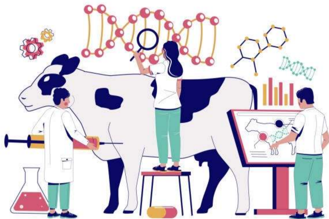
GENETICALLY MODIFIED ANIMALS